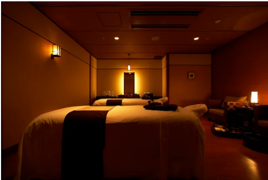
SPA ROOM tenの様子